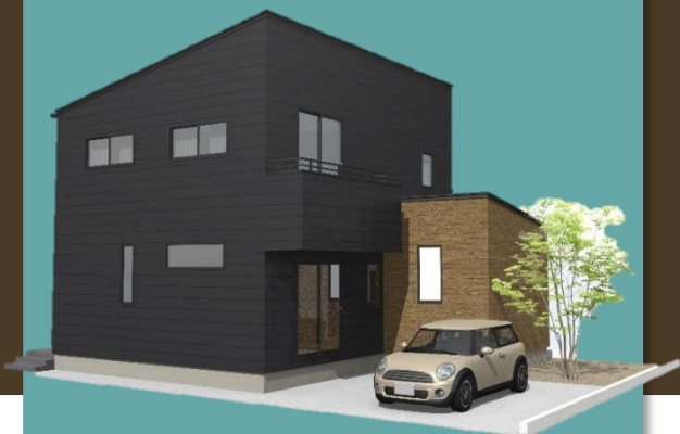
ビンテージ スタイル Vintage Style