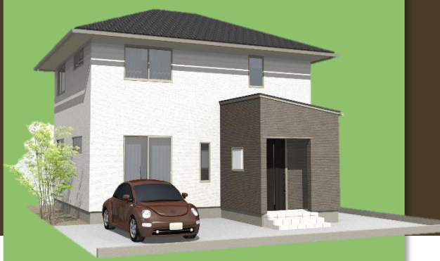
ナチュラル スタイル Natural Style