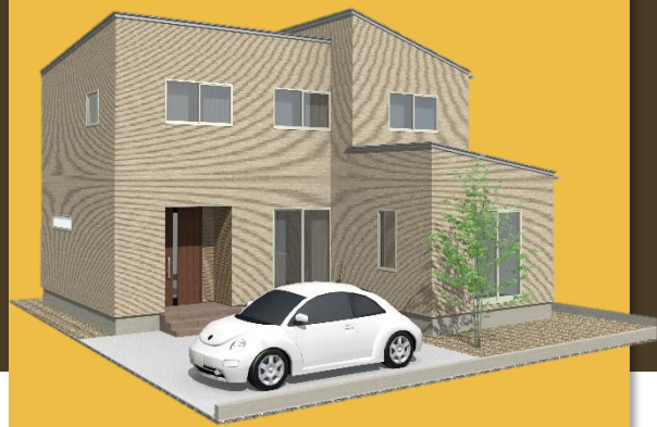
ジャパニーズモダン スタイル Japanese Modern Style